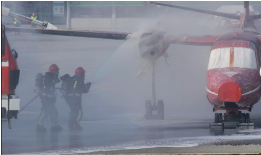
C'è fumo all'aeroporto. E non sono gli aerei a bruciare...

PRIMA PAGINA TICINO SVIZZERA MONDO SPORT ECONOMIA PIAZZA DEL CORRIERE